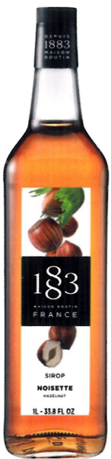
Ø ORZECH LASKOWY I136:12979