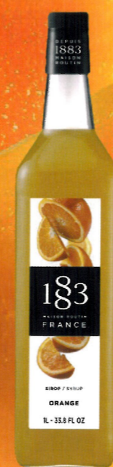
◊ POMARAŃCZOWY I136:13296