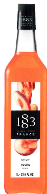
◊ BRZOSKWIOWY I136:13283