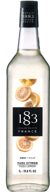
◊ YUZU 1136:23997