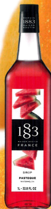
◊ ARBUZOWY I136:13281