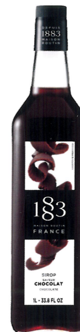
Ø CZEKOLADOWY I136:12971