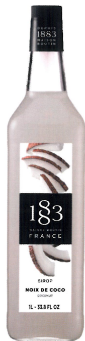
Ø KOKOSOWY I136:12977