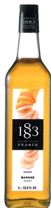
◊ BANANOWY I136:12969