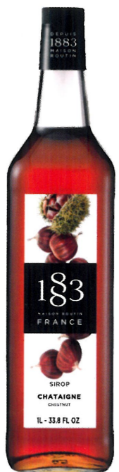
Ø ORZECH MACADAMIA I136:13478