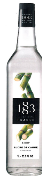
Ø CUKROWY I136:12970