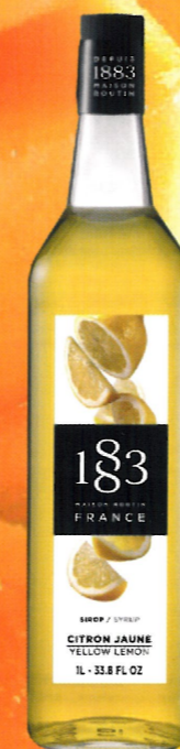
Ø CYTRYNOWY I136:13845