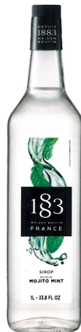
◊ MOJITO 1136:13294