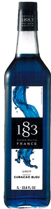
◊ BLUE CURAÇAO 1136:13282