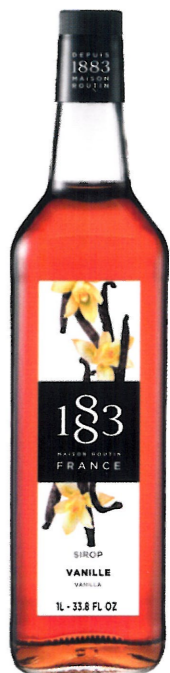
◊ WANILIOWY 1136:12983