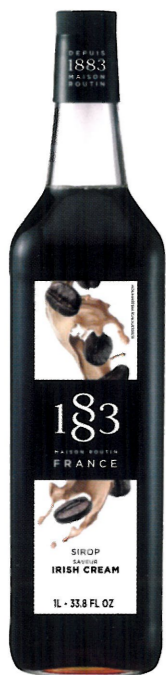
◊ IRISH CREAM 1136:12975