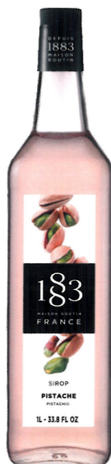
Ø PISTACJOWY I136:13795