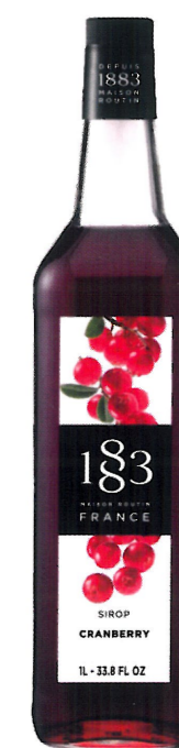
Ø ŻURAWINOWY I136:13792