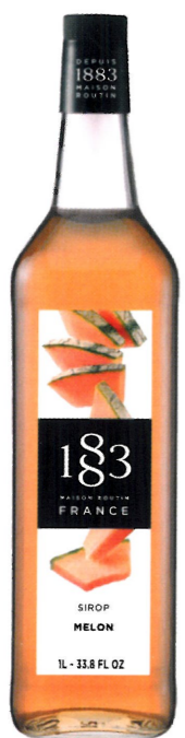
◊ MELONOWY I136:13292