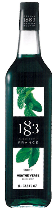
◊ ZIELONA MIĘTA 1136:12984