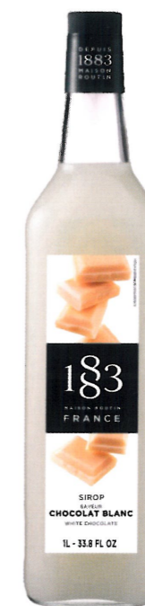
Ø BIAŁA CZEKOLADA I136:13793