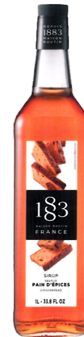
◊ PIERNIKOWY 1136:13295