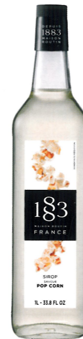
◊ POPCORN 1136:23998