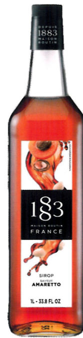
◊ AMARETTO 1136:12968