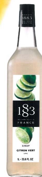
Ø LIMONKOWY I136:13849