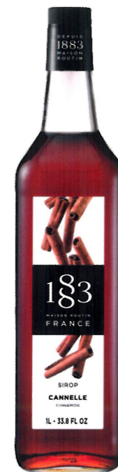
◊ CYNAMONOWY 1136:13284