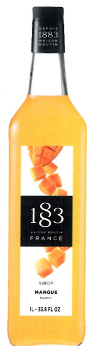
◊ MANGO I136:13290