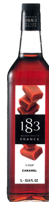
Ø KARMELOWY I136:12976