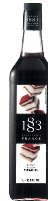
Ø TIRAMISU I136:13797