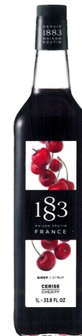
◊ WIŚNIOWY 1136:13638