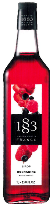
◊ GRENADINE 1136:12973