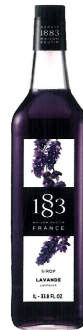
◊ LAWENDOWY 1136:12978