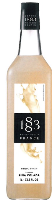
◊ PIÑA COLADA 1136:13850