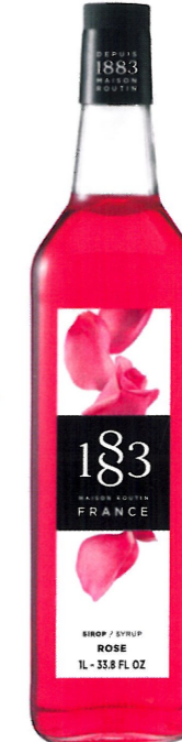
◊ RÓŻANY 1136:13796