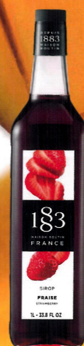
◊ TRUSKAWKOWY I136:12982