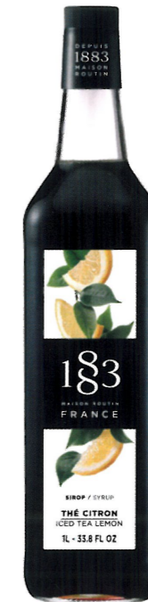
◊ ICE TEA CYTRYNOWY 1136:12974