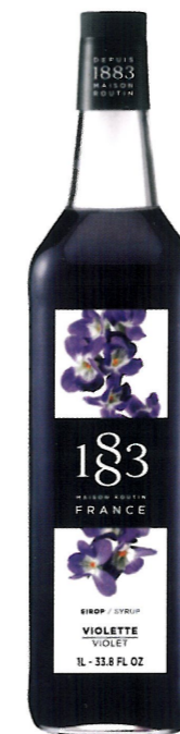
◊ FIOŁKOWY 1136:23996