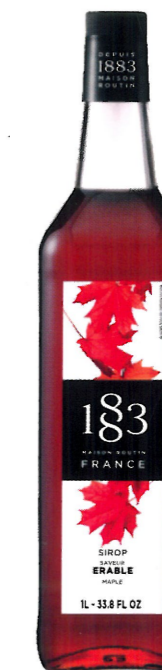
Ø KLONOWY I136:13289