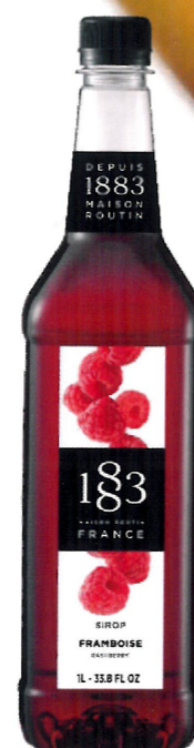
◊ MALINOWY PET I136:16230