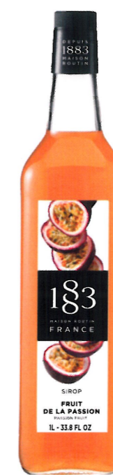
Ø MARAKUJA I136:13291