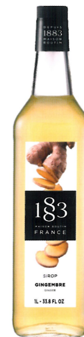
◊ IMBIROWY 1136:13794